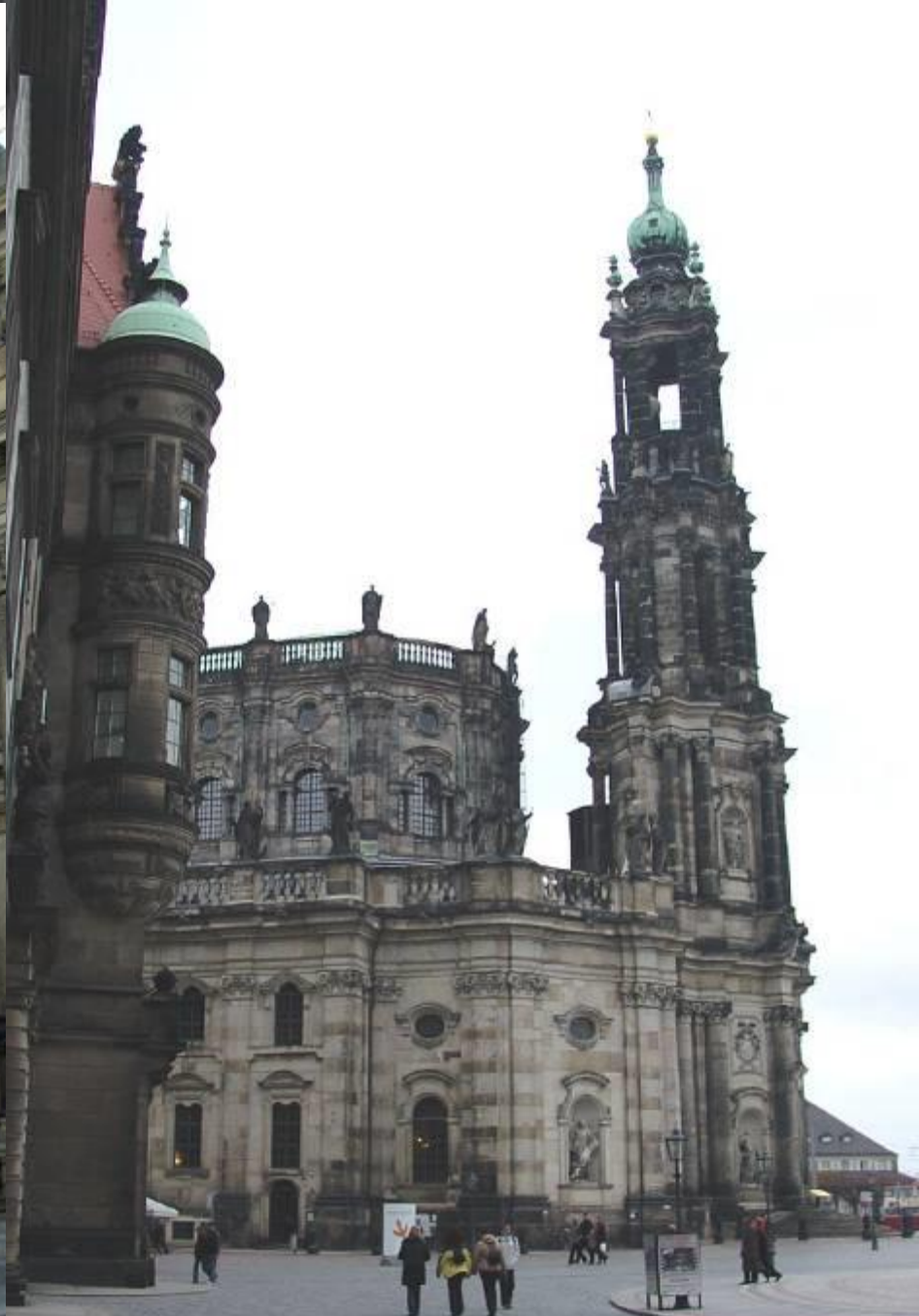
Дворците и черквите в центъра са както преди 200 години ..