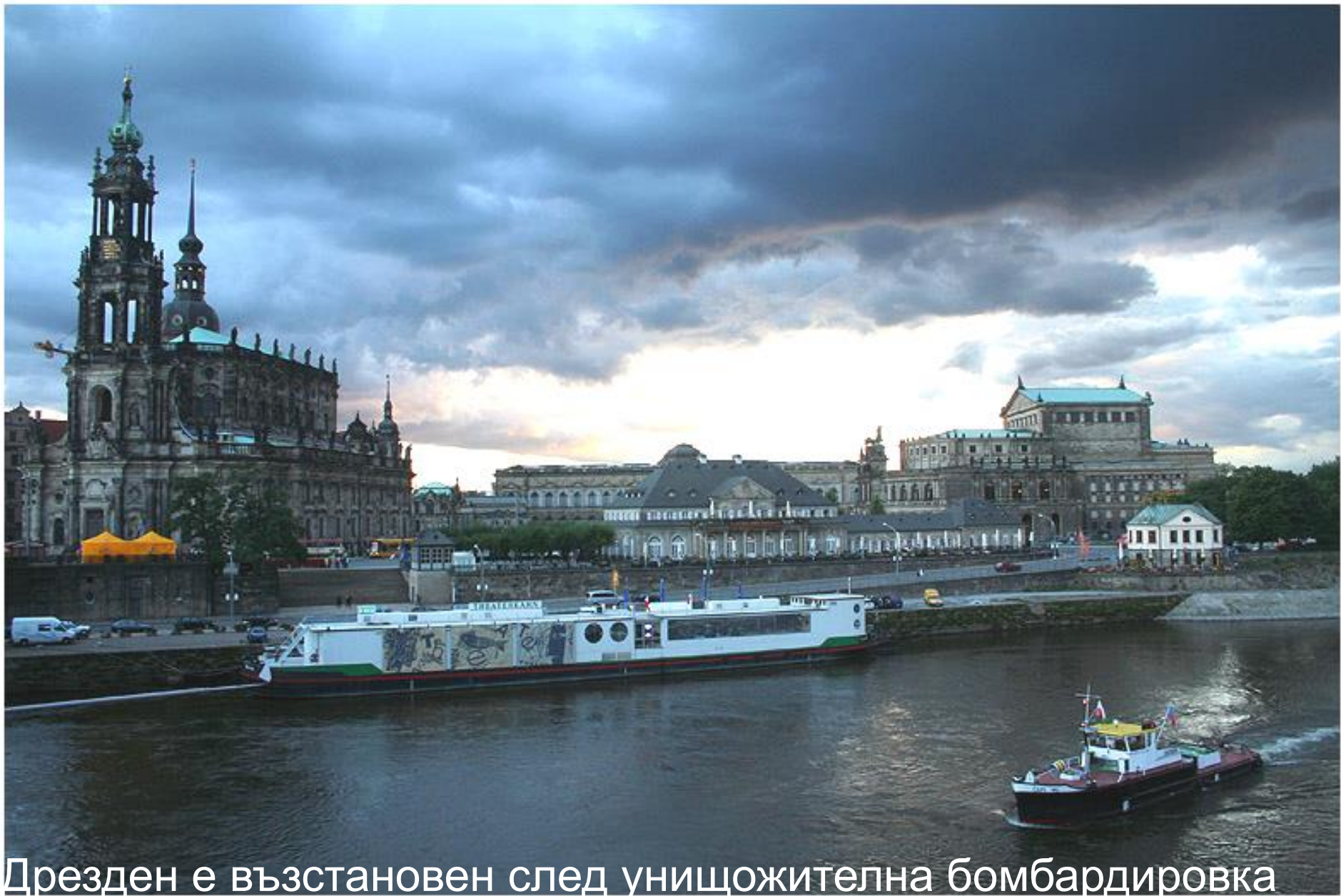
Дрезден е възстановен след унищожителна бомбардировка през февруари 1945 г. Тук са Саксонският дворец, Zwinger, Semper Oper и Italienische Doerfchen.