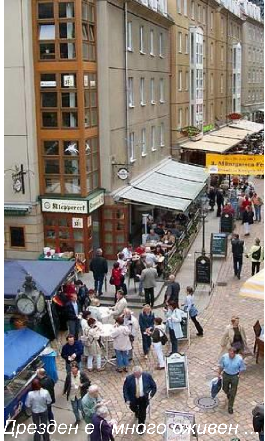
... а съвременният Дрезден е много оживен ...