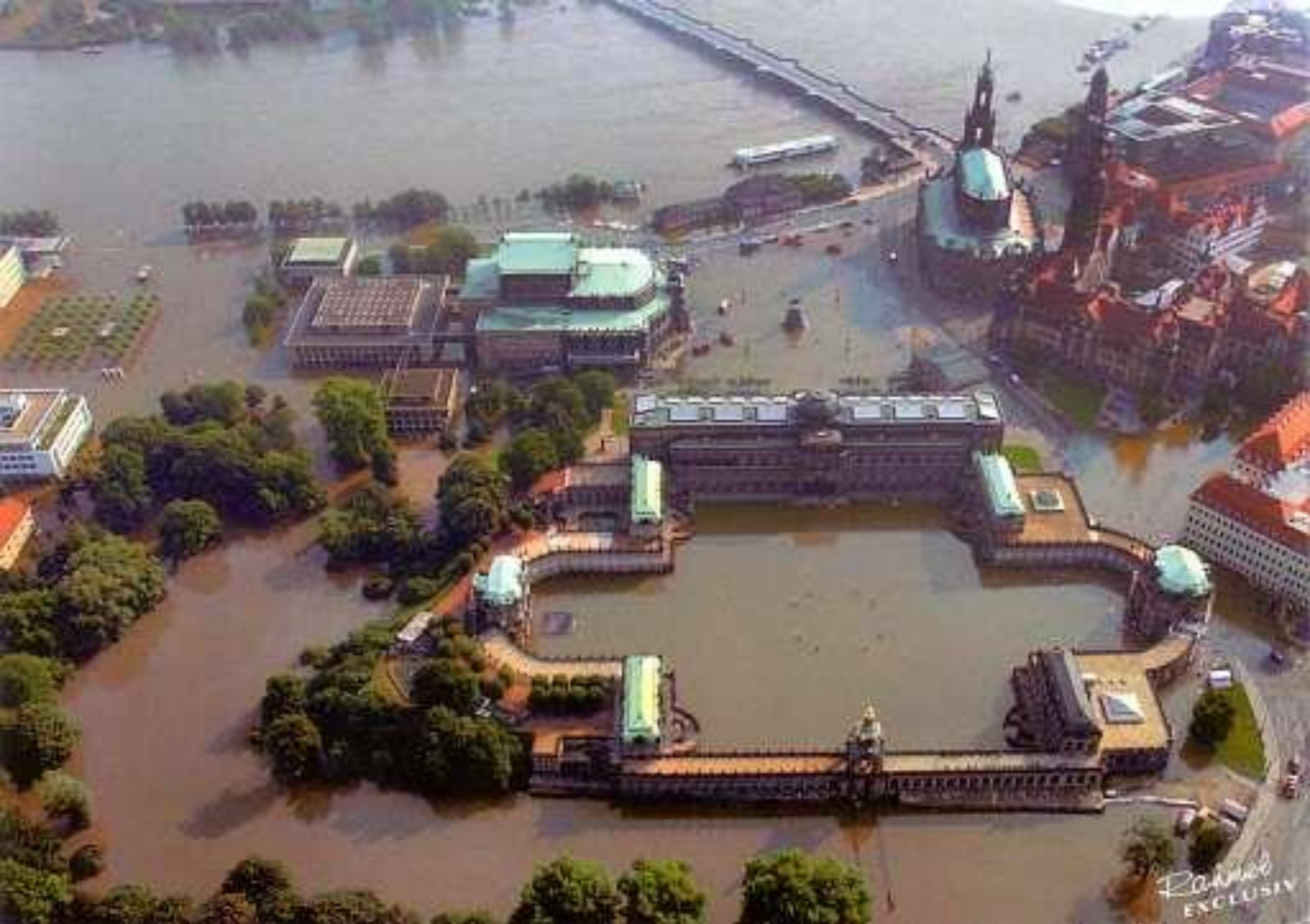
Наводнените Zwinger. Semper Oper и дворци през 2002/2003.