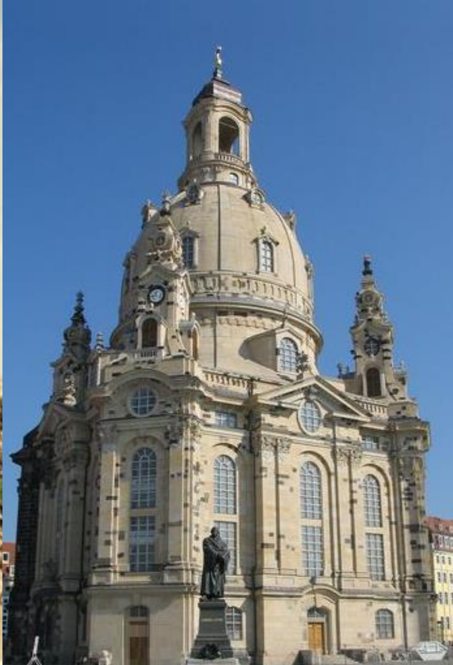
Frauen Kirche до 2000 година ... и след 2005 година